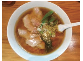
チャーシューめん

真冬の平日や雪の日でも臨時休業にはしないとのこと。皆さんもお出かけになってみてはいかがでしょうか？