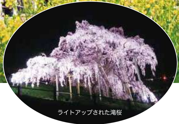
ライトアップされた滝桜